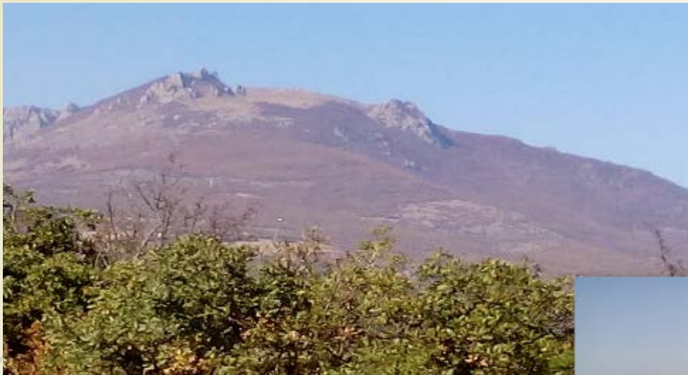
↑ ВЕЛИЧИЕ КРЫМСКИХ ГОР